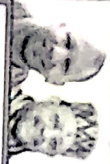
पूर्वांचल इस वजह में क्या भिला